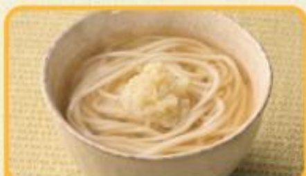
かけうどん 商品番号 0911 356円(税込)