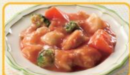
鶏肉のトマト煮 商品番号 0242 583円(税込)