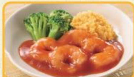
エビと玉子のチリソースがけ 商品番号 0022 648円(税込)