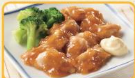
豚肉の生姜炒め 商品番号 0240 648円(税込)