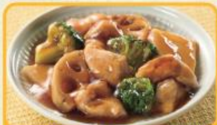
豚肉のオイスターソース炒め 商品番号 0241 648円(税込)