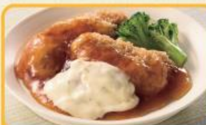
チキン南蛮 商品番号 0243 583円(税込)